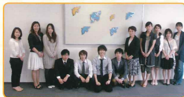
平成22年度卒業記念品の前で