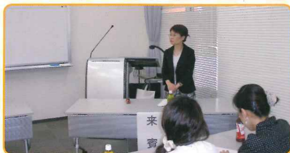
八島学部長ご挨拶