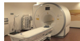
3T-MRI 装置 脳ドック、膵がんドック