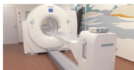
PET/CT 装置 各臓器のがん検査