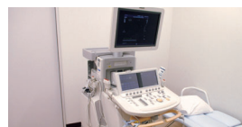
超音波検査装置 心臓、肝臓がん、腎臓がん、胆石の検査